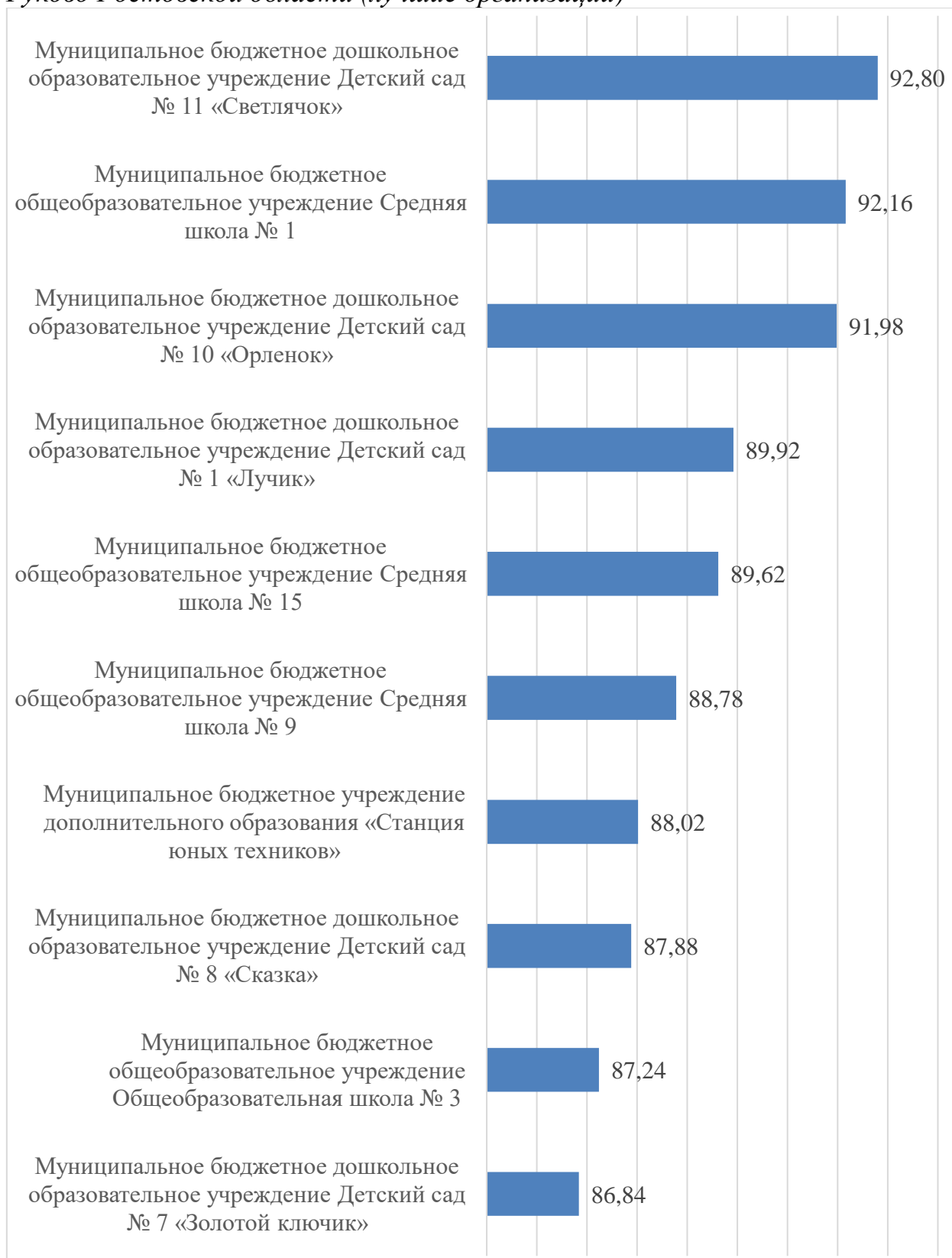
Гистограмма 1. Итоговый рейтинг по результатам сбора, обобщения и анализа информации о качестве условий оказания услуг организациями, осуществляющими образовательную деятельность на территории города Гуково Ростовской области (лучшие организации)